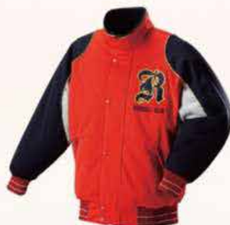
[CGW-64] フライズ: 袴 A-26, 袖・裾 E-309 A: レッド B: 紺ネイビー C: グレー パイピング: 31 ゴールド