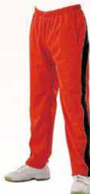
[CGW-59] A: レッド B: 紺ネイビー パイピング: 31 ゴールド