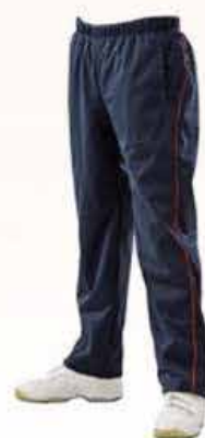
[CGW-58] A: 紺ネイビー パイピング: 11 エンジ