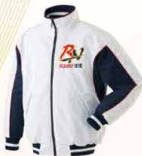
[CGW-71] フライズ: 袴・袖・裾 D-261 A: ホワイト B: 紺ネイビー パイピング: 09 レッド