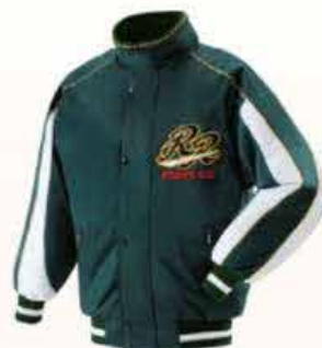
[CGW-63] フライズ: 袴 A-15, 袖・裾 D-151 A: グリーン B: グリーン C: ホワイト パイピング: 31 ゴールド