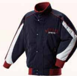
[CGW-63] フライズ: 袴・袖・裾 A-11 A: 紺ネイビー B: 紺ネイビー C: グレー パイピング: 11 エンジ